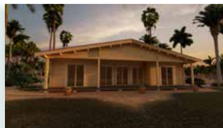
MONTE GORDO T3

Os orçamentos têm a validade de 30 dias depois disso terá de nos consultar sobre o preço. Caso haja erro tipográfico, salvaguardamo-nos o direito de retificar.